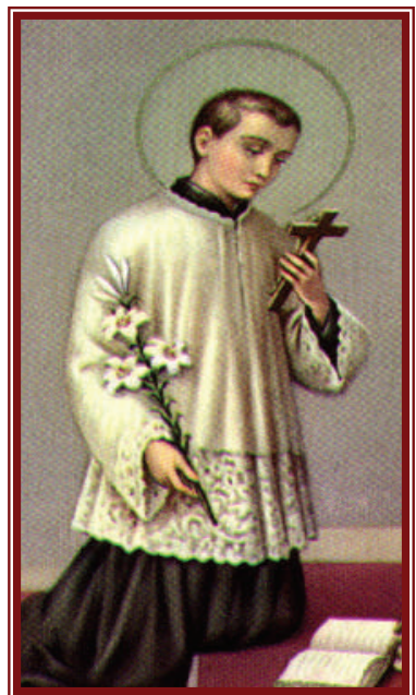
Growing and Sharing in Jesus Christ